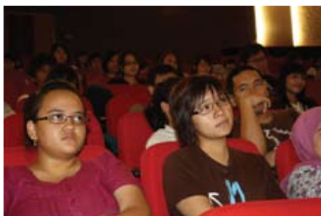
► Tema market Outlook, Consumer Income & Spending mengajak peserta lebih memahami pasar modal.

Sebagai informasi, pasar modal ( Capital Market ) merupakan kegiatan yang berhubungan dengan penawaran umum dan perdagangan efek, perusahaan publik yang