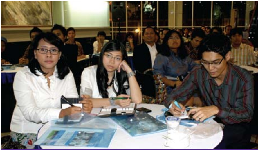
► Lebih dari 70 peserta yang berasal dari berbagai perusahaan hadir dalam Creativity in The PR World