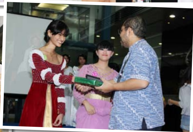
>> Final Assignment mahasiswa bertemakan Costume History