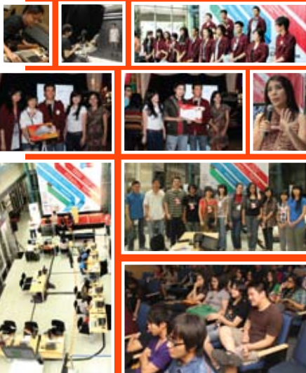
Foto-foto acara Digital Artvolution