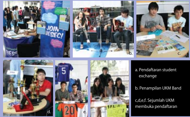
a. Pendaftaran student exchange b. Penampilan UKM Band c,d,e,f. Sejumlah UKM membuka pendaftaran

Dalam sekejap, lobby gedung JWC pun disulap menjadi arena pameran dan pertunjukkan. Para mahasiswa baru pun tampak memadati lobby seraya mengunjungi booth setiap UKM. Seluruh UKM di BINUS INTERNATIONAL turut andil dalam expo ini. Sebut saja, BEST (BI English Society), BIPEDS (BI Pool of English Debaters), BIJAC (BI Japanese Club) dan STUCOMM.(RA)