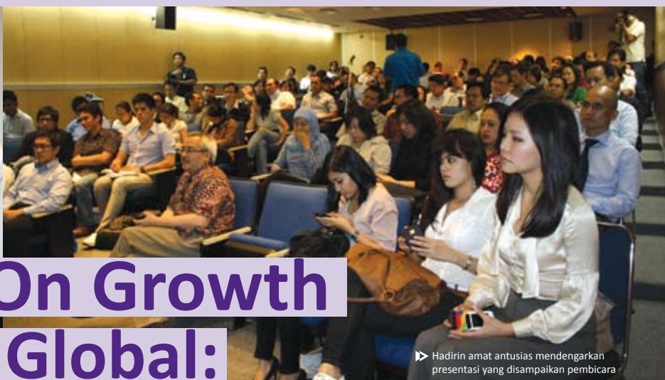
► Hadirin amat antusias mendengarkan presentasi yang disampaikan pembicara