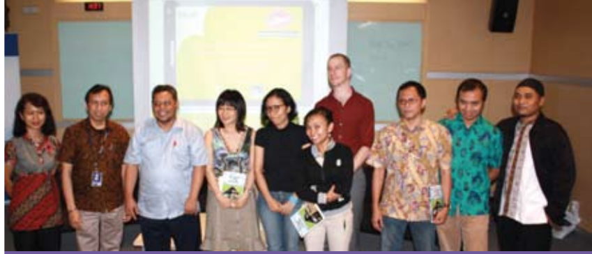
Berpose usai peluncuran buku Mau Dibawa Ke Mana Sinema Kita .