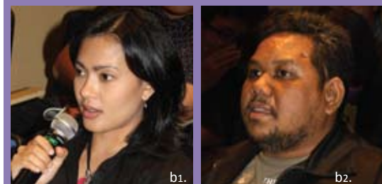
Tanpa canggung, para peserta mempresentasikan film karya mereka di hadapan para juri dan peserta lainnya. c.